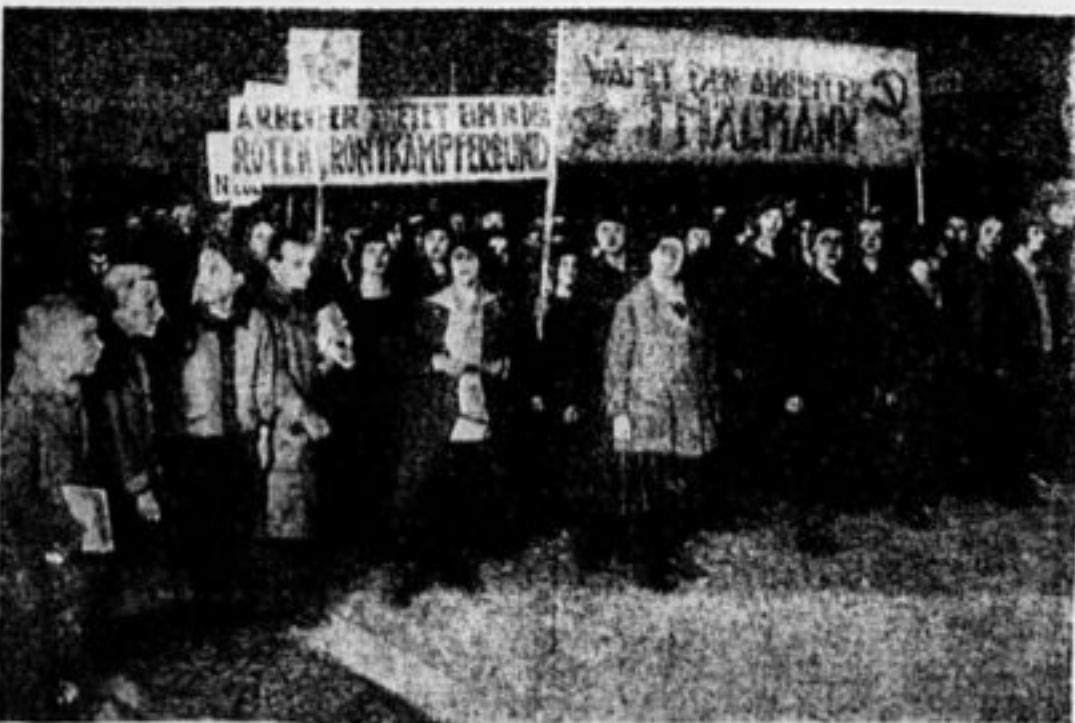
Демонстрация германских комсомолок и пионеров, призывающих голосовать при выборах президента за коммуниста, рабочего Тельмана.